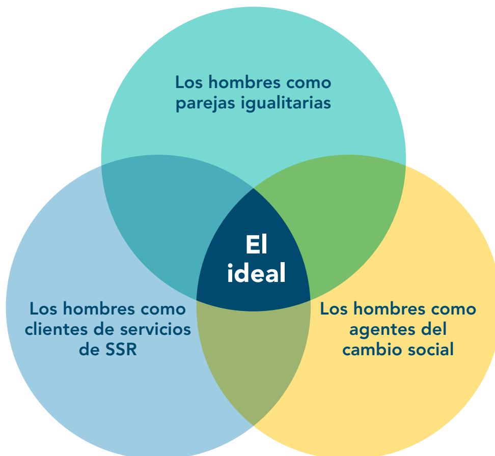
Figura 1. Los papeles de los hombres en la salud y los derechos sexuales y reproductivos