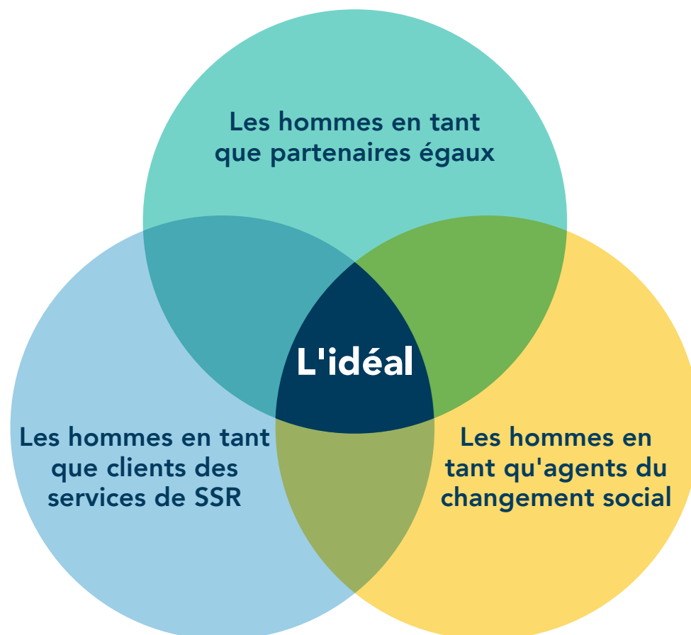
Figure 1. Les rôles des hommes dans la santé et les droits sexuels et reproductifs